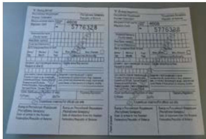
1-rasm – Ariza uchun migratsiya kartasi

Ro'yxatga olish asosiga ko'ra, Vakolatli organ (FMS) chet elliklarni ro'yxatga olish to'g'risidagi belgi bilan arizaning asosiy qismini (ajraladigan qismini) beradi(2-rasm).